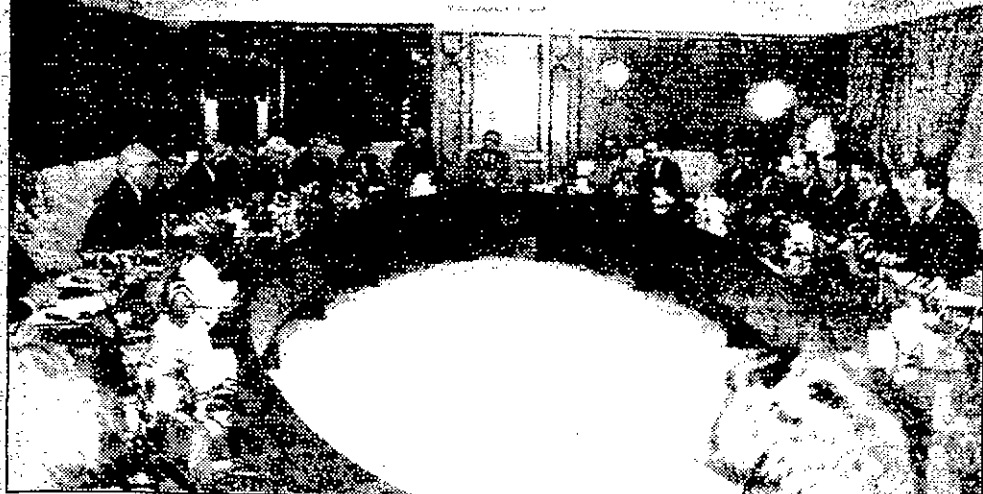
● جلالة الحسين يترأس جانباً من جلسة مجلس الوزراء بحضور سمو الأمير الحسن

الإحداث الأخيرة واضحة في مغزائها والقدس يجب ألا تكون موضوع مساومة على السيادة من قبل أي طرف من الأطراف المباشرة